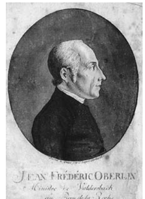
John Frederic Oberlin (1740-1826)