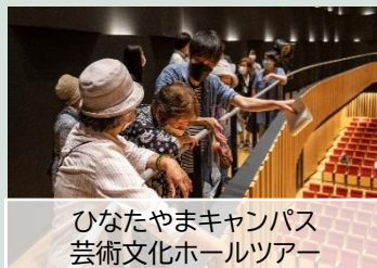
ひなたやまキャンパス 芸術文化ホールツアー